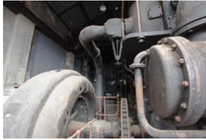
Salle des compresseurs