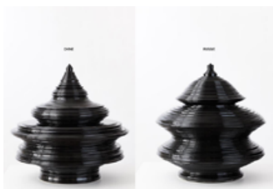
Mathieu Lehanneur, Céramique

Form follows information nous amène dans une autre dimension de ce détournement de la célèbre formule de Sullivan. Littéralement, les objets choisis par le Studio GGSV rendent visibles, sensibles, les masses de données collectées en permanence par nos objets connectés : carte-relief de nos géolocalisations, création céramique à partir de la pyramide des âges d'une région en un temps donné.